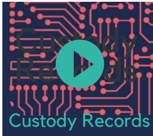
СИСТЕМА ФИКСАЦИИ ДАННЫХ В МЕСТАХ НЕСВОБОДЫ