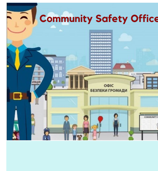
ПОЛИТИКИ БЕЗОПАСНОСТИ В ГРОМАДАХ